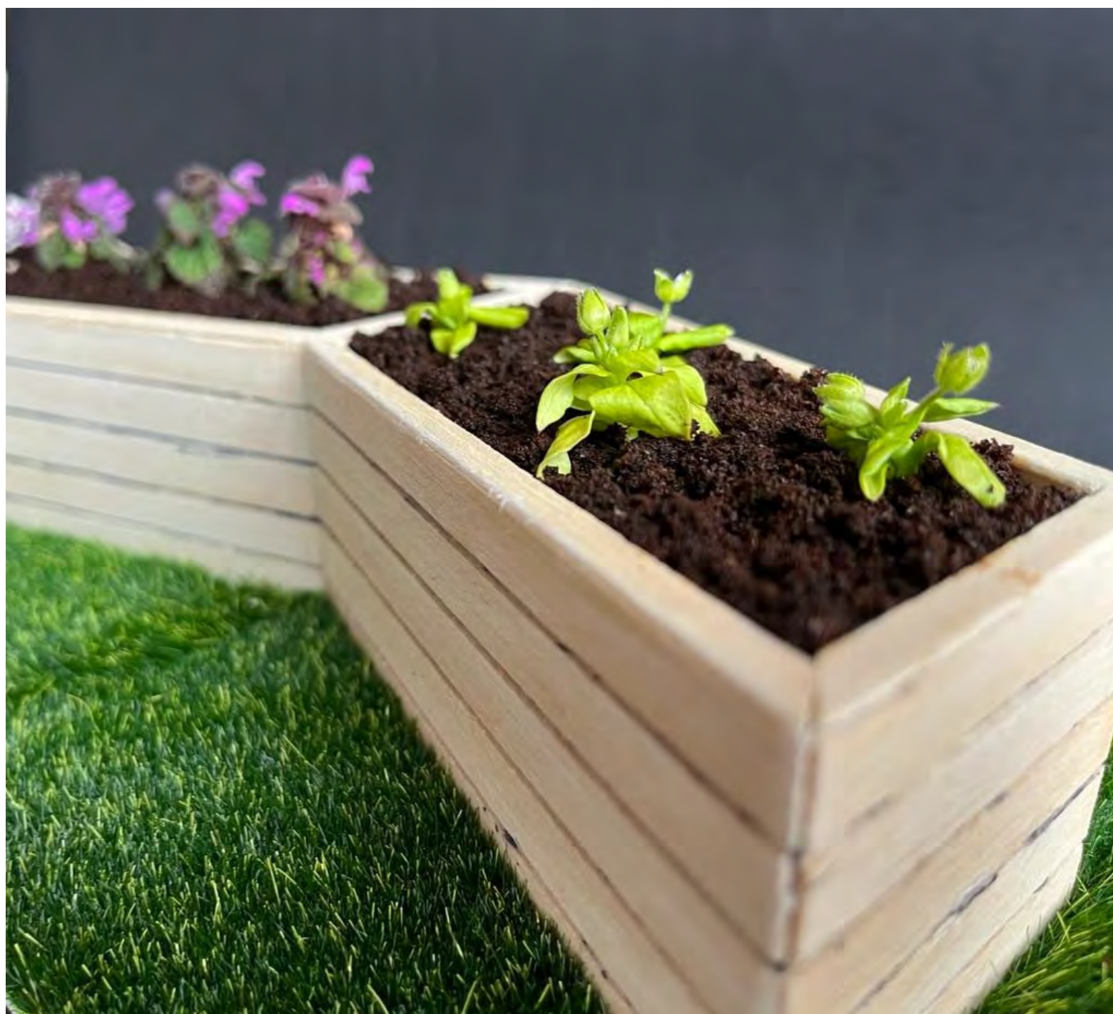
Abbildung 7: Modellfoto 3

zwischen(un)RAUM23 | Wiederbelebung der Nachbarschaft