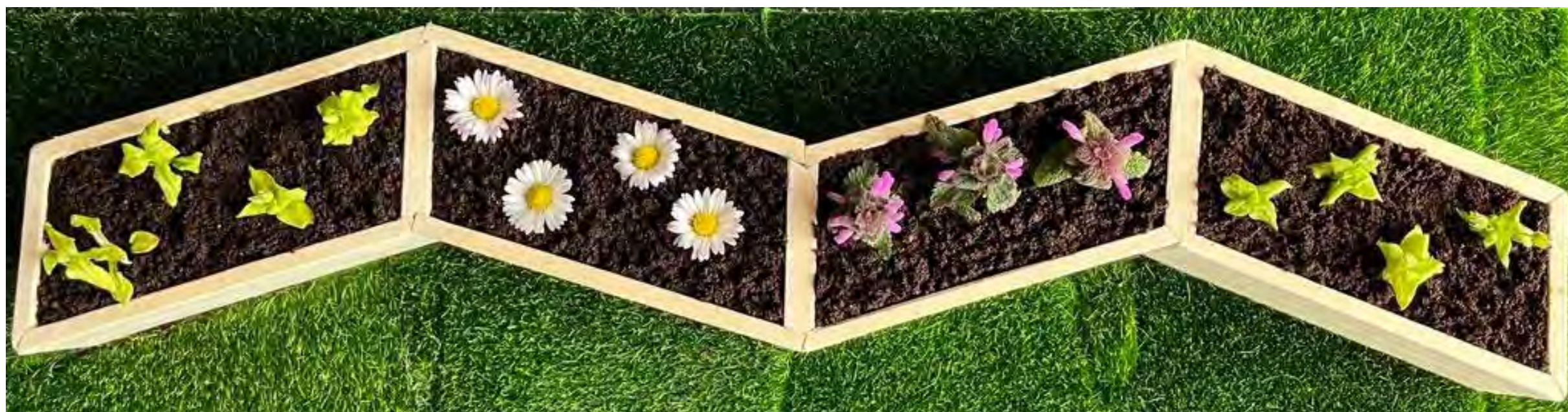
Abbildung 6: Modellfoto 2

zwischen(un)RAUM23 | Wiederbelebung der Nachbarschaft