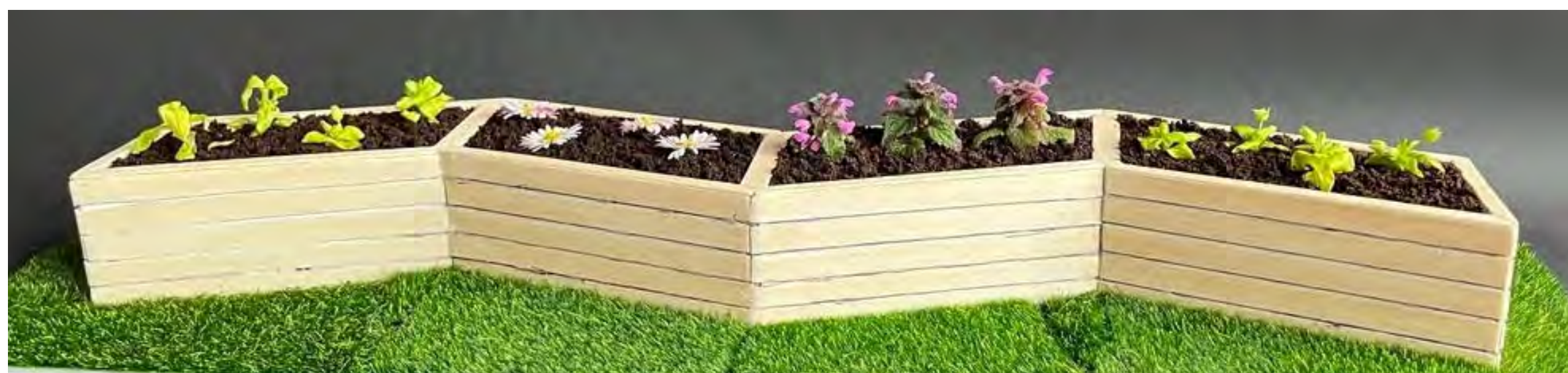
Abbildung 1: Modellfoto 1

zwischen(un)RAUM23 | Wiederbelebung der Nachbarschaft