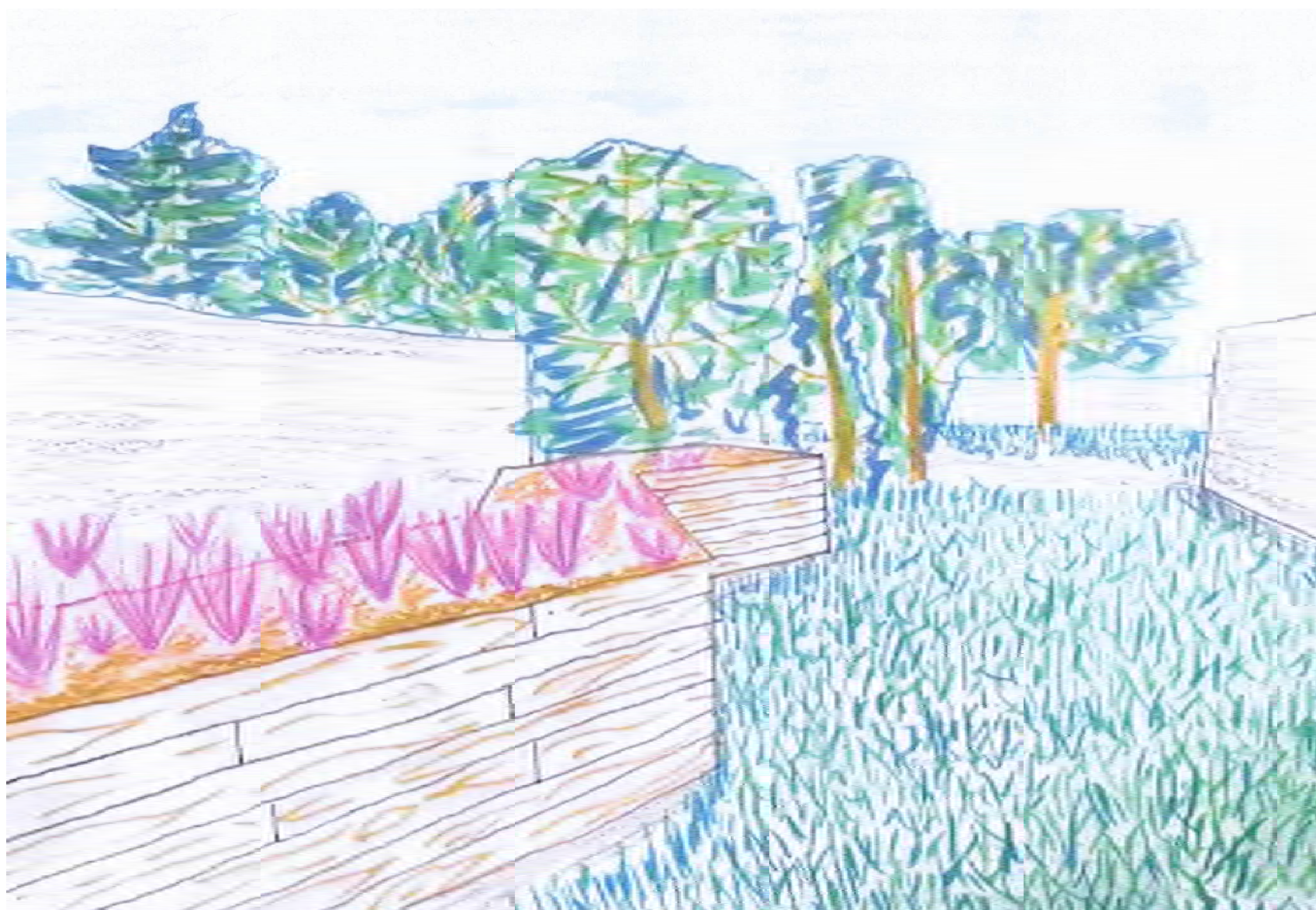
Abbildung 4: Zeichnung