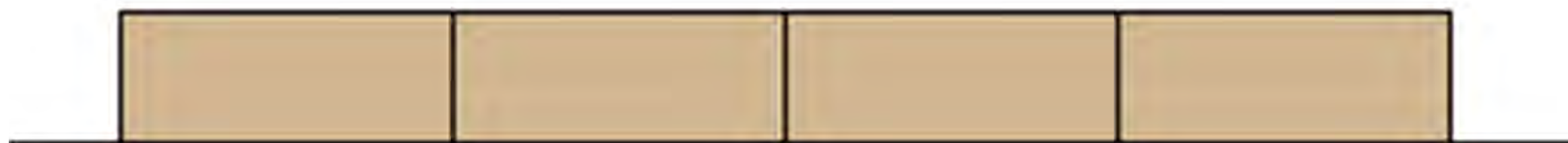
Abbildung 2: Ansicht

zwischen(un)RAUM23 | Wiederbelebung der Nachbarschaft